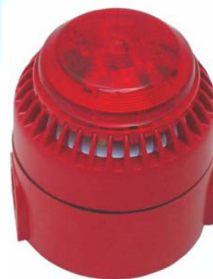
Sirene Alarme com Strobo Sirayl