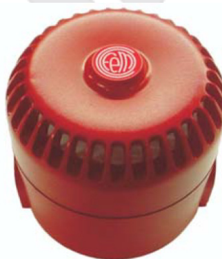
Sirene Alarme Siray

A variante SIRAYL possui sinalizador luminoso (strobo), sendo parametrizada na CDI da mesma forma que a SIRAY.