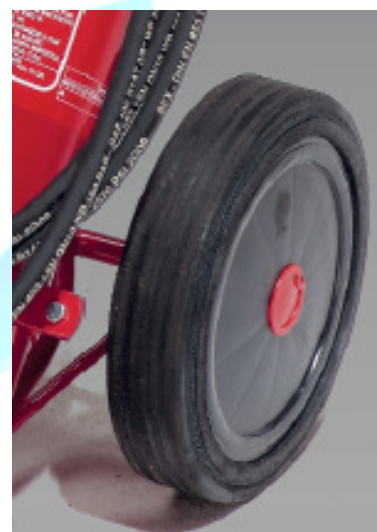
Rodados com grande diâmetro. Elevada mobilidade.