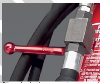
Controlo da descarga do agente de extinção, através de válvula.