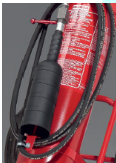
Unidade muito fácil de operar.