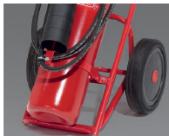
Chassis tubular muito robusto. Quadro desmontável.